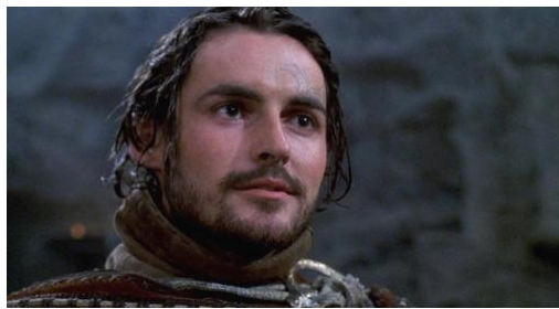
Leniseï Zapyatayev, Elfe barde gitan Razel Malagan, Prêtre de Séluné