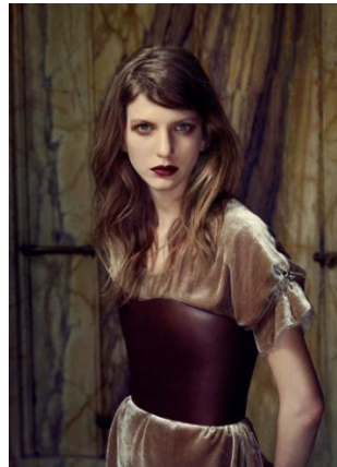
Lambda, la serveuse